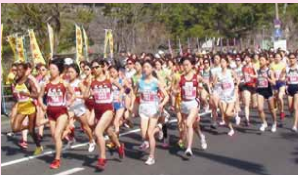
▲松江の街に駆け出す選手たち