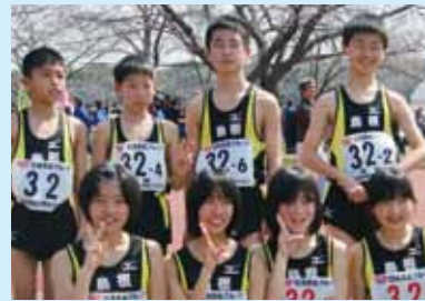
▲出場した選手のみなさん