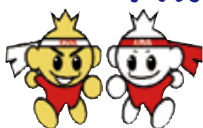
女性委員会マスコットキャラクター 【陸ちゃん 上ちゃん】

女性委員会のマスコットキャラクターは、様々なグッズにシールしています。たとえば、レディース陸上の参加賞のクリアファイルなど…今後、このキャラクターを使った商品開発なんてことも…あるかもしれませんね。